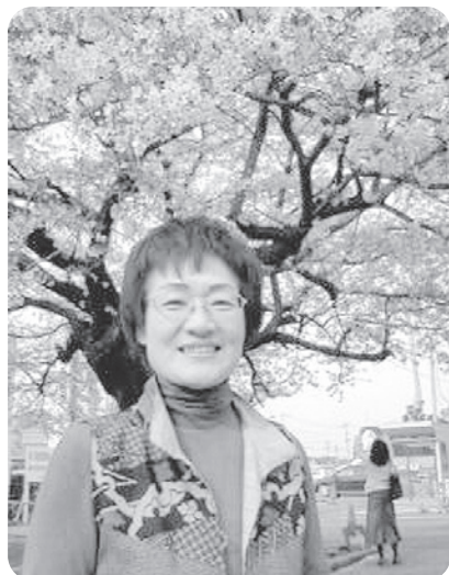
美しい市役所前の桜